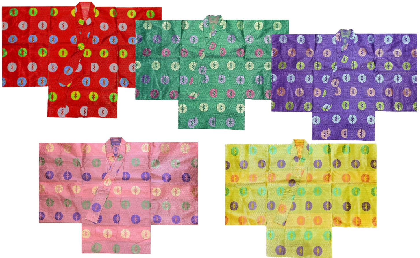
テトロン三色切返亀甲に向い蝶