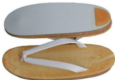
婦人用草履 キルク