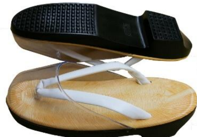
婦人用草履 ウレタン