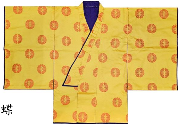
冬物テトロン無双織 三重菱に向い蝶