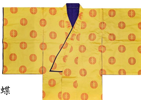
冬物テトロン無双織 三重菱に向い蝶