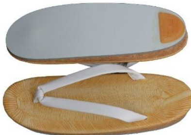
婦人用草履 キルク