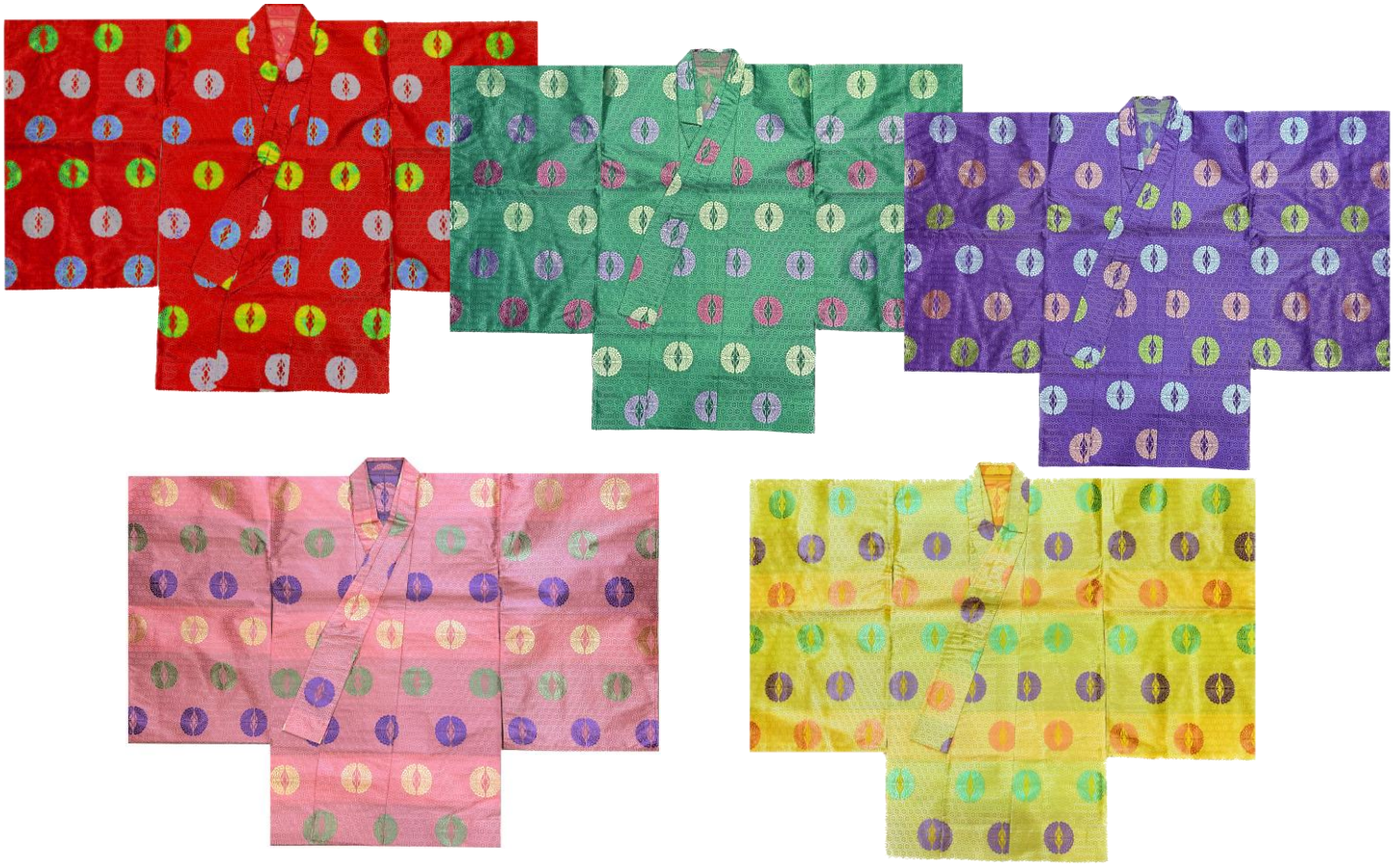
テトロン三色切返亀甲に向い蝶