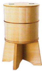
台付手水桶 直径26cm×高43cm