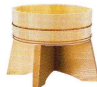
台付丸半桶 直径30cm×高12cm