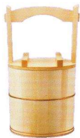
柄付手水桶 直径26cm×高50cm