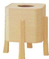
小型拭紙入 7寸角×高9寸