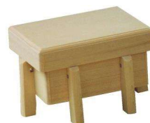
切麻用唐櫃 木曾桧材