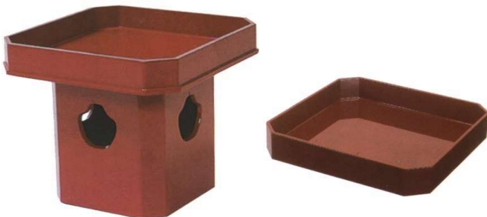
朱三宝・折敷 木製