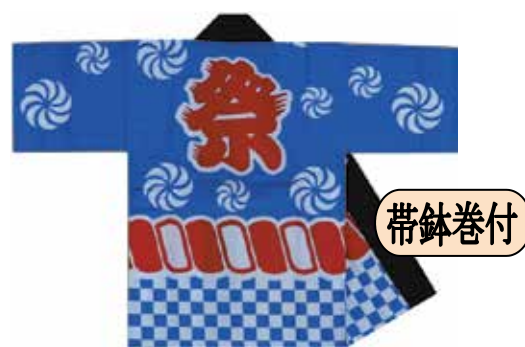
子供半天 反応染/市松赤縄柄