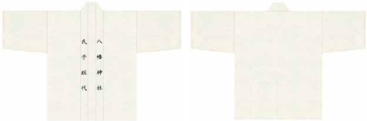
衿文字のみ染入れの場合