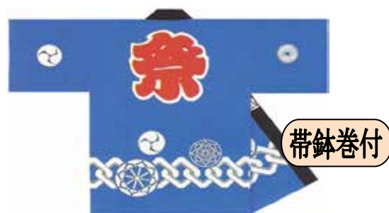
子供半天 顔料染/吉原つなぎ