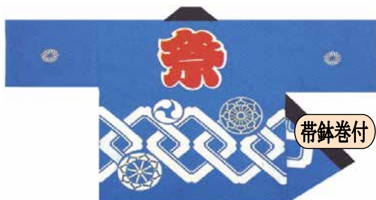
大人半天 顔料染/吉原つなぎ