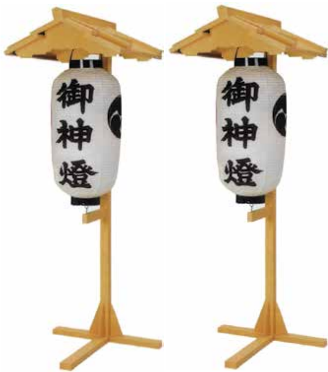
ステンレス製提灯掛 1対