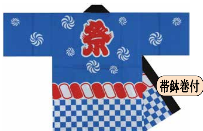
大人半天 反応染/市松赤縄柄