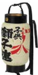
弓張提灯 子供獅子連