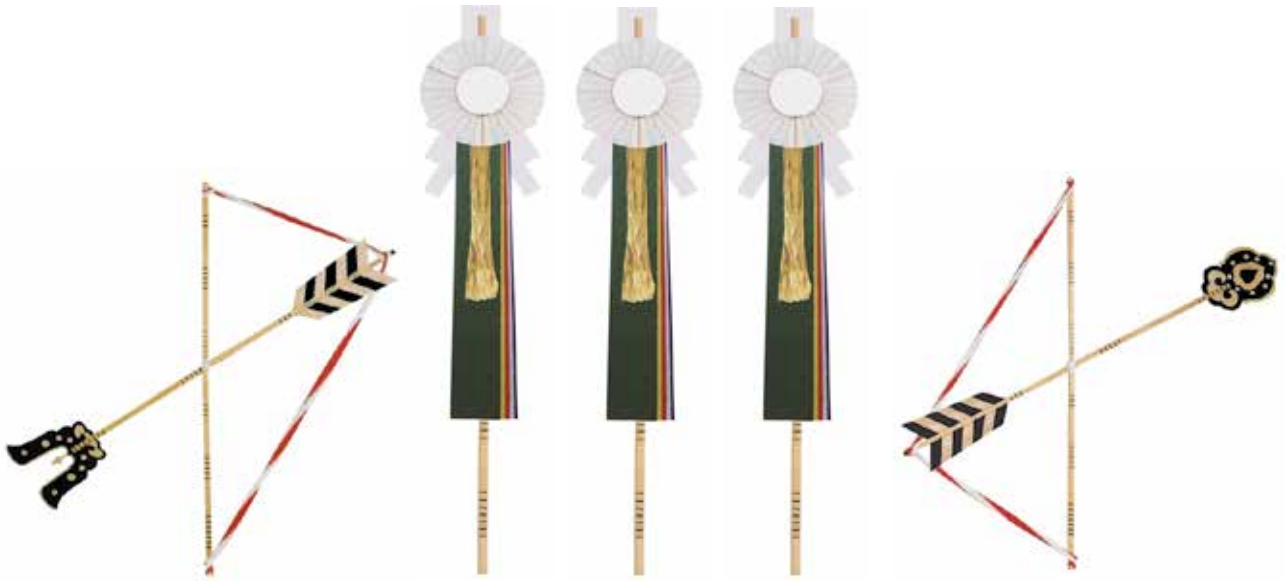
天の矢6尺×1寸角、地の矢6尺×1寸角、御幣10尺×1寸5分角3本(五色・扇・神鏡付)